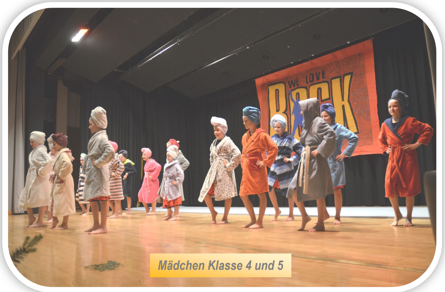
Mädchen Klasse 4 und 5